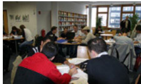
Arbeitsplätze in der Bibliothek