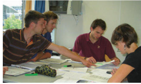
Teamarbeit während des Planspiels

Mit der Bachelorarbeit und dem daran anschließenden Kolloquium über die Bachelorarbeit wird das Studium abgeschlossen. Die Bachelorarbeit ist eine schriftliche Hausarbeit über ein abgegrenztes Problem. Ein betriebswirtschaftliches Seminar begleitet die Bachelorarbeit, um diese theoretisch und methodisch zu fundieren.