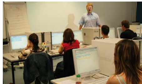
Lehrveranstaltung im PC-Pool